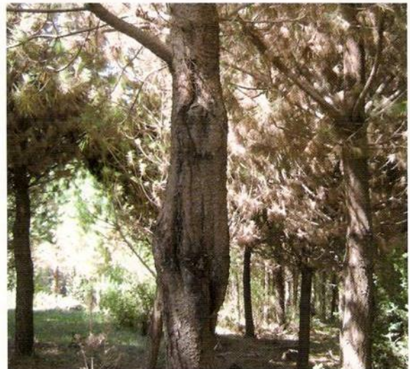
Figura N°3. Revirado del pino causado por Neonectria fuckeliana , Región de La Araucanía

La plaga ingresa al árbol principalmente a través de heridas, causadas por la poda, afectando la calidad de la madera. Actualmente se está estudiando el manejo de esta práctica silvicultural como medida preventiva a considerar para disminuir esta enfermedad en los pinos.