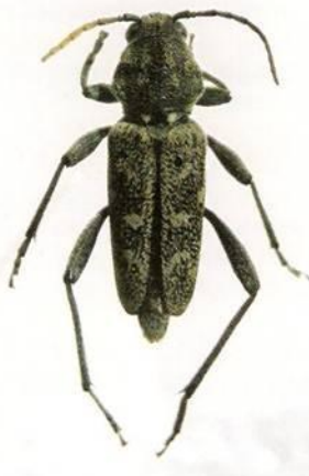
Figura N°7. Adulto de Rusticoclytus rusticus .

Durante octubre del año 2009 este insecto fue detectado por primera vez en la Región de La Araucanía sobre Populus nigra en la comuna de Renaico, correspondiente éste a su hospedero principal. Anteriormente, la distribución de R. rusticus en el país comprendía sólo algunas comunas de la Región del Bío Bío.