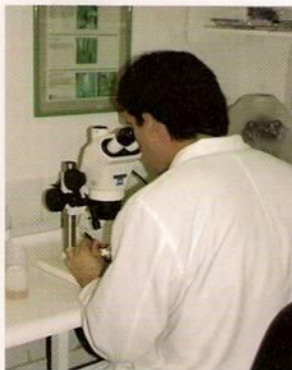
Figura N°1. Disección de larvas de Sirex noctilio .

En el ámbito del mismo programa, durante el mes de julio de 2009, finalizó el proceso de evaluación de niveles de parasitismo que se realiza en forma anual (temporada 2008/2009) en las dependencias del Laboratorio Regional SAG/Osorno, observándose en esta oportunidad niveles de parasitismo en hembras adultas de la plaga por el nematodo Beddingia siricidicola del orden del 26,5% de parasitismo, lo que señala un incremento respecto a lo observado en la temporada 2007/2008 cuando el nivel de parasitismo detectado fue del 13,6 %.