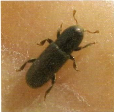
Figura N°6. Adulto de Hylastes linearis .

Detectado por primera vez el año 2006 en la Región del Libertador Bernardo O'Higgins, posteriormente ha sido capturado en trampas de embudos en las Regiones de Valparaíso, Maule, Bío Bío y en octubre del año 2009 en la Región Metropolitana.