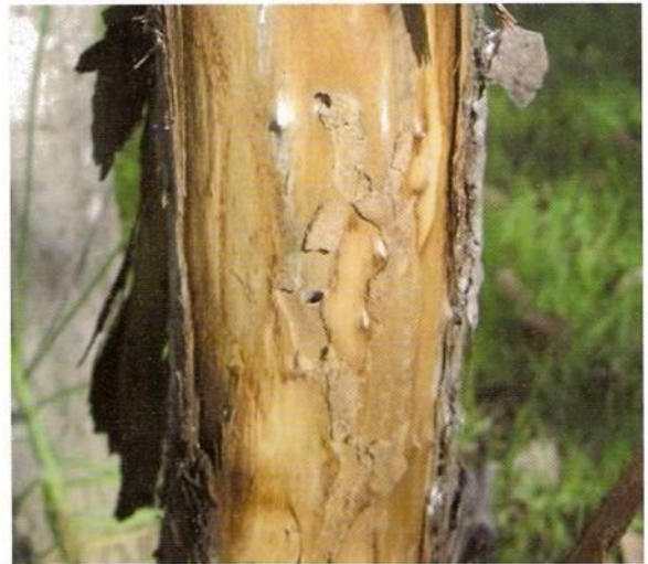
Figura N°8. Daño de Alcathousites asperipennis en Populus sp.

En el mes de abril del año 2009 se detectó sobre árboles recién muertos o debilitados Populus sp., realizando galerías bajo la corteza de los árboles. La detección tuvo lugar en la comuna de Coquimbo, Región de Coquimbo, obteniéndose larvas, pupas y adultos del insecto.