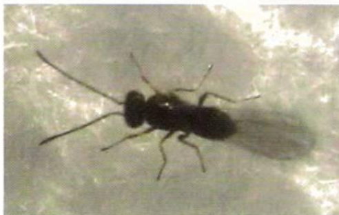
Figura Nº11. Ejemplar adulto de Anaphes tasmaniae .