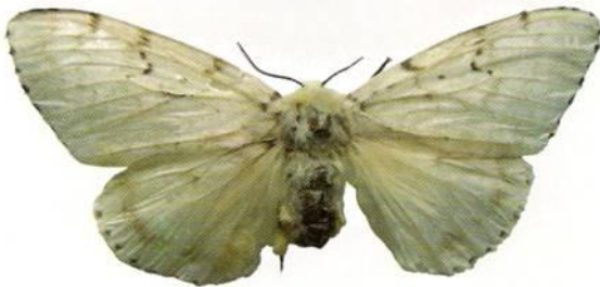
Figura N°14. Hembra de Lymantria dispar .

Durante el mes de diciembre del año 2008, en el Puerto de Houston, Texas, USA se interceptaron masas de huevo viable de L. dispar en una motonave. Las autoridades norteamericanas determinaron que la motonave probablemente se infestó con L. dispar en los puertos de Okke y Donhhae, ubicados en Corea del Sur, ya que ésta estuvo en dichos puertos en la época de vuelo de la polilla (julio de 2008). Posteriormente, en agosto de ese mismo