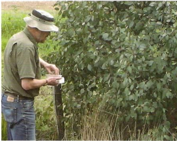
Figura Nº10. Colecta de Ootecas de Gonipterus scutellatus parasitadas por Anaphes tasmaniae .

Posterior a la colecta de A. tasmaniae , los insectos han sido sometidos a cuarentena de post-entrada en las instalaciones del SAG/Lo Aguirre, realizándose a la fecha la liberación de 550 individuos adultos, en plantaciones de eucalipto infestadas por la plaga en las Regiones de Valparaíso, O'Higgins, La Araucanía y Los Ríos.