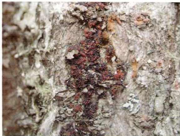
Figura Nº4. Peritecios anaranjados dispuestos en racimos sobre corteza de Pinus radiata , Región de Los Ríos.