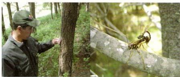
Figura N°9. Liberación de Megarhyssa nortoni . Región de Los Lagos.

Durante el segundo semestre del año 2008 el SAG realizó la inoculación con Beddingia siricidicola , de parcelas cebo ubicadas en áreas bajo cuarentena de las Regiones de La Araucanía a Los Lagos. El SAG inoculó 912 parcelas cebo con un total de 4.560 árboles. Adicionalmente se realizó la liberación de 9 núcleos del parasitoide Megarhyssa nortoni (Hymenoptera, Ichneumonidae), con tres núcleos en cada una de las regiones con presencia de la plaga.