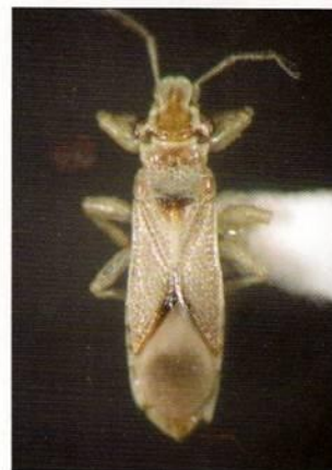
Figura N°2. Adulto de Thaumastocoris peregrinus .

Acciones de vigilancia han determinado que hasta la fecha la plaga se encuentra circunscrita en un área de poco más de 10 km. de radio en la localidad de Til Til, Región Metropolitana y un brote aislado en la comuna de Rinconada - Región de Valparaíso.