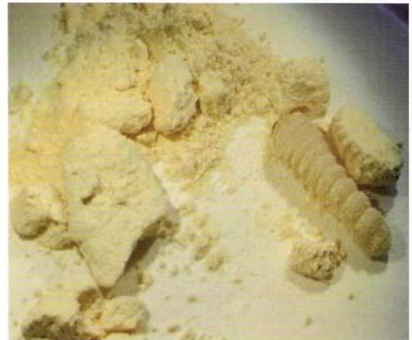
Figura Nº12. Larvas de Hylotrupes bajulus .

Como resultado de las actividades realizadas se determinó que el insecto no se estableció en el país.