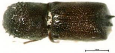
Figura N°13. Adulto de Sinoxylon conigerum .

Por otro lado, un 75% de las intercepciones de insectos de importancia forestal ocurrieron en embalajes marcados, lo que indica que habían sido sometidos a un tratamiento fitosanitario en origen señalado en la Res. N°133/05 del SAG.