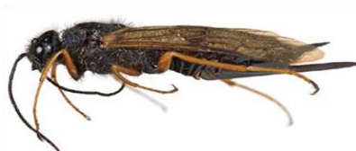
Sirex noctilio : Hembra